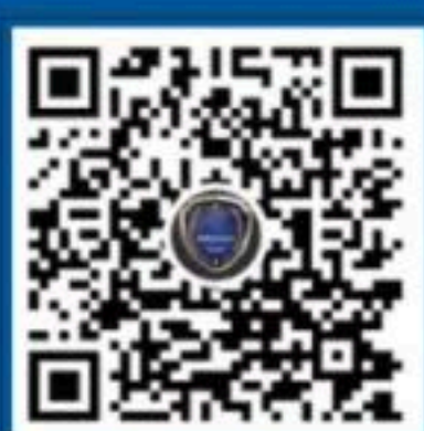
国家反诈中心 微信视频号