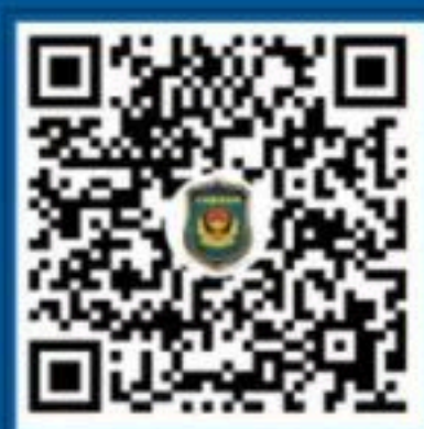
公安部刑侦局 微信视频号