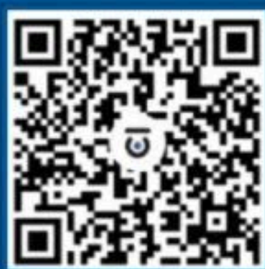
国家反诈中心 百家号