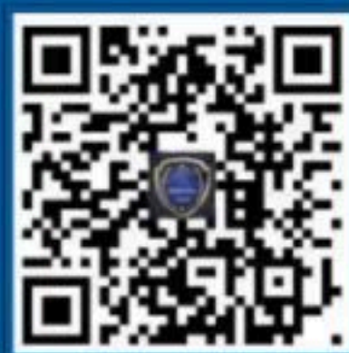
国家反诈中心 企鹅号