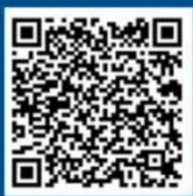
国家反诈中心 快手号