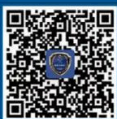
国家反诈中心 APP Android 下载