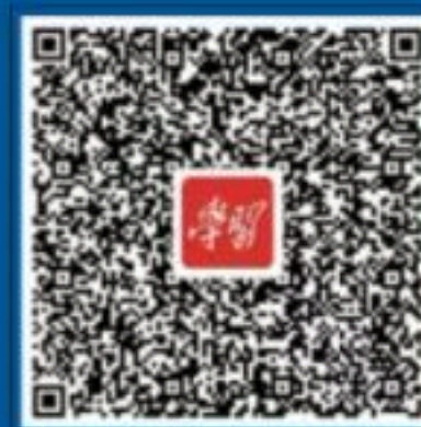
国家反诈中心 强国号