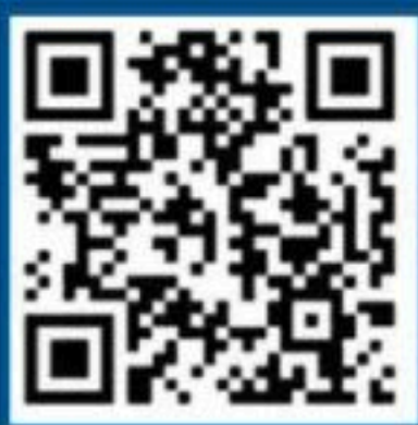
国家反诈中心 人民号