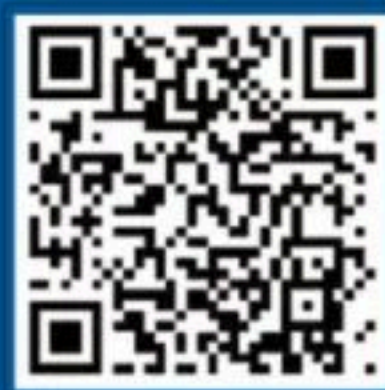
国家反诈中心 微博号